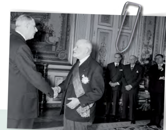
René Cassin et le général de Gaulle.