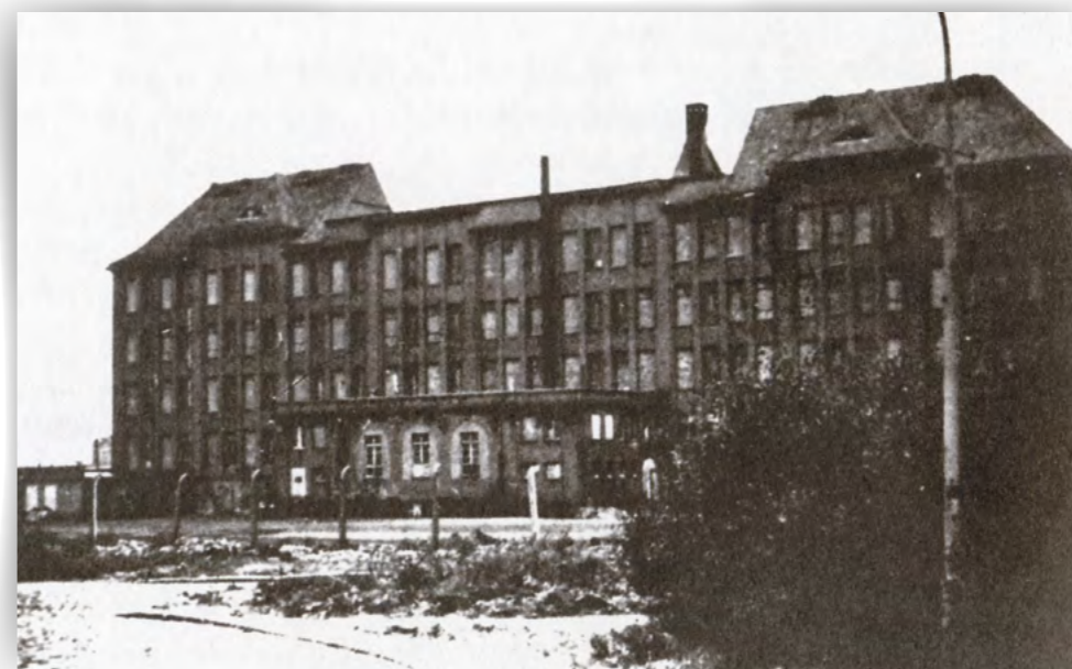
L'école de Bullenhusen Damm, à Hambourg, en 1945.