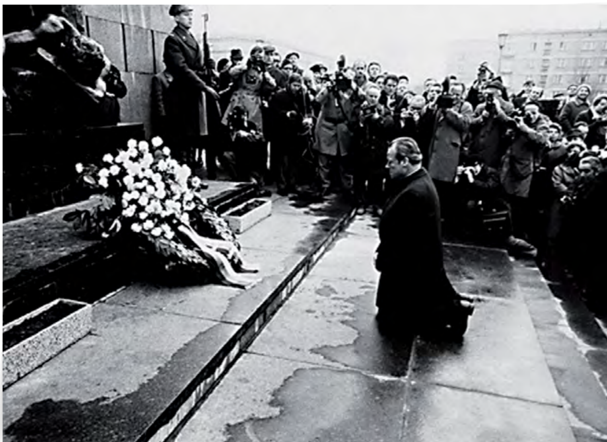
Le Chancelier Willy Brandt s'agenouille devant le monument à la mémoire des victimes du Ghetto de Varsovie.