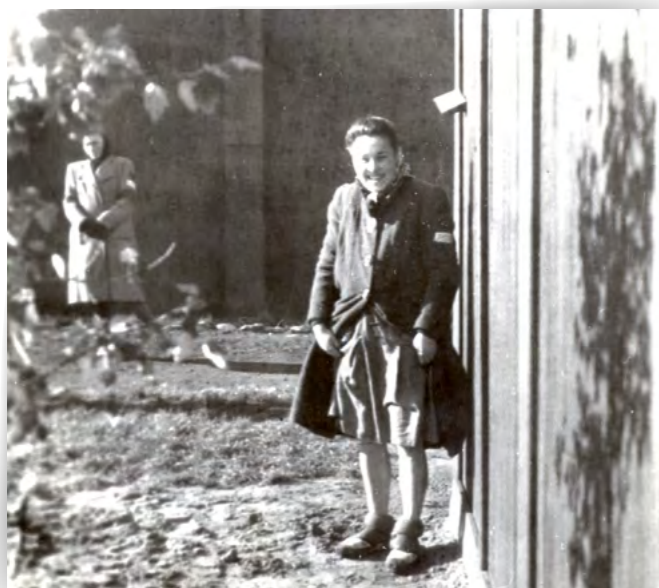
Photographie de la jambe d'une des victimes des expériences pseudo-médicales de SS. Professeur Gebhardt prise clandestinement par les Polonaises en septembre 1944. Au fond à gauche, une détenue fait le guet.