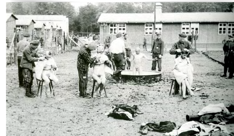
Désinfection et tonte des détenus à leur arrivée (zone du camp de Buchenwald réservée aux juifs polonais, probablement en automne 1939).

Wolfgang Sofsky, L'organisation de la terreur , Calmann-Lévy, 1995, p. 107.