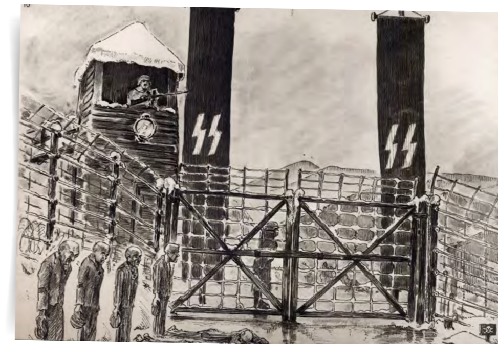
Le piquet, punition individuelle, Natzweiler. Dessin d'Henri Gayot.