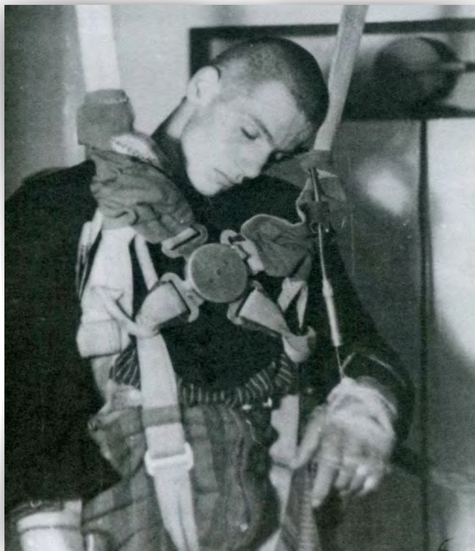
Expérience concernant la résistance du corps humain soumis aux basses pressions, menée sur un détenu à Dachau en 1942.

Aussitôt achevé le procès des grands criminels de guerre, c'est dans les mêmes lieux que la juridiction américaine entreprend de juger d'autres accusés, regroupés par professions ou fonctions : hommes politiques, industriels, médecins. Douze procès succèdent ainsi à celui des grands criminels de guerre. Le premier est celui des médecins, administrateurs et personnels des différents services de santé et de recherche allemands, impliqués dans les expérimentations médicales pratiquées sur les détenus dans les camps de concentration, comme les inoculations de virus ou d'agents bactériens, tests d'endurance au froid ou aux variations brutales de pression, stérilisations d'hommes, de femmes et d'enfants, prélèvements d'organes à des fins d'études en laboratoires d'anatomie, etc. Du 15 novembre 1946 au 21 août 1947, vingt-trois médecins nazis comparaissent devant un Tribunal militaire américain, dont la compétence et la mission relèvent de la Loi n° 10 du Conseil de contrôle de l'Allemagne. À travers ce procès, c'est le principe des expérimentations médicales criminelles qui est jugé. En effet, la révélation de pseudo-expériences scientifiques pratiquées sur des déportés et de l'implication de nombreux médecins a profondément choqué l'opinion publique. Au moment de rédiger son jugement, le tribunal éprouve donc le besoin de rassembler et de formaliser des principes éthiques jusqu'ici éparés, dans un prologue connu sous la dénomination de code de Nuremberg.