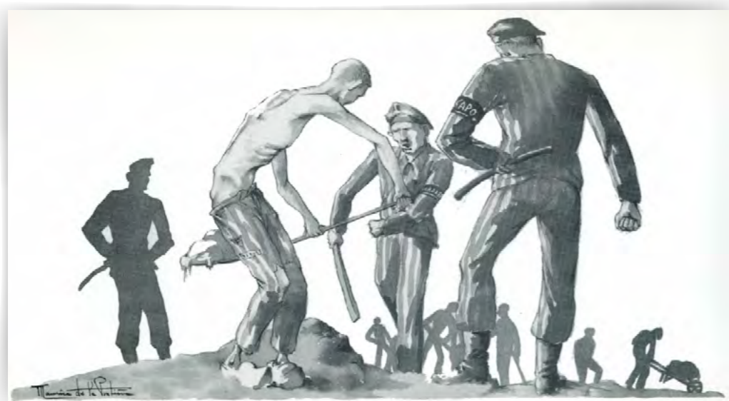
Où chaque pelletée de terre était mouillée de leurs larmes et de leur sang. Dessin de Maurice de la Pintièrre, réalisé à son retour de déportation en 1945.